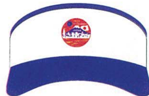
サンバイザー：正面