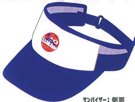
サンバイザー：側面